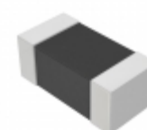
EZJ-Z0V270AA Panasonic Electronic Components VARISTOR 27V 0402