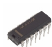
MAX4620EPD+ Maxim Integrated IC SWITCH QUAD SPST 14DIP