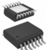
NCV47411PAAJR2G ON Semiconductor IC REG LDO ADJ 0.1A DL 14TSOP