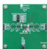
NCV47551DAJGEVB AMI Semiconductor / ON Semiconductor EVAL BOARD NCV47551DAJG