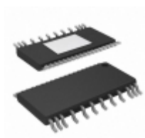
LT3753EFE#PBF Linear Technology IC REG CTRLR FWRD CONV 38TSSOP