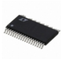
LT3752MPFE-1#PBF ADI (Analog Devices, Inc.) IC REG CTRLR FWRD CONV 38TSSOP