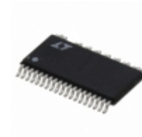
LT3752MPFE#TRPBF Linear Technology IC REG CTRLR FWRD CONV 38TSSOP