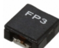
FP3-R20-R Eaton FIXED IND 200NH 15.3A 1.88 MOHM