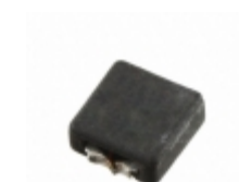
FP3-4R7-R Eaton FIXED IND 4.7UH 3.23A 40 MOHM