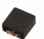
FP3-2R0-R Eaton FIXED IND 2UH 5.4A 15 MOHM SMD