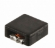
FP3-8R2-R Eaton FIXED IND 8.2UH 2.91A 74 MOHM