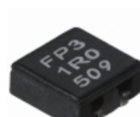
FP3-1R0-R Eaton FIXED IND 1UH 6.26A 11.2 MOHM