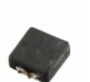
FP3-3R3-R Eaton FIXED IND 3.3UH 3.63A 30 MOHM