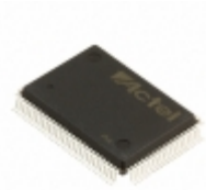
A40MX04-3PQG100I Microsemi Corporation IC FPGA 69 I/O 100QFP