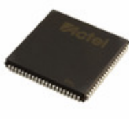
A40MX04-FPL84 Microsemi Corporation IC FPGA 69 I/O 84PLCC