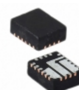
MIC33264YGK-TR Microchip Technology IC REG BUCK ADJ 2A SYNC 20QFN