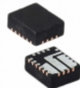
MIC33263YGK-T5 Microchip Technology IC REG BUCK ADJ 2A SYNC 20QFN