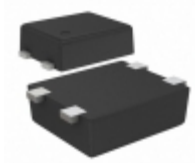
S-80131BLPF-JEQT2G SII Semiconductor Corporation IC VOLT DETECTOR 3.1V SNT-4A