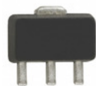
SBF-5089Z RFMD IC AMP HBT INGAP/GAAS SOT-89