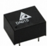
DA01S0515A Delta Electronics DCDC CONVERTER 15VOUT 1W