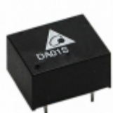
DA01S0515A Delta Electronics DC DC CONVERTER 15V 1W