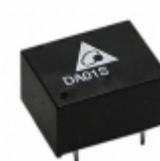
DA01S0512A Delta Electronics DCDC CONVERTER 12VOUT 1W