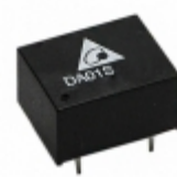
DA01S1205A Delta Electronics DC DC CONVERTER 5V 1W