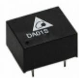
DA01S0509A Delta Electronics DC DC CONVERTER 9V 1W