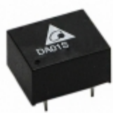
DA01S0509A Delta Electronics DCDC CONVERTER 9VOUT 1W