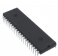
AT89LP51RD2-20PU Microchip Technology IC MCU 8BIT 64KB FLASH 40DIP