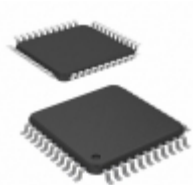
AT89LP6440-20AU Microchip Technology IC MCU 8BIT 64KB FLASH 44TQFP