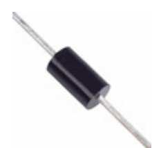
1.5KE47CA-B Diodes Incorporated TVS DIODE 40.2VWM 64.8VC DO201A