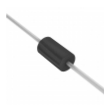
1.5KE47CA-E3/51 Electro-Films (EF1) / Vishay TVS DIODE 40.2V 64.8V 1.5KE