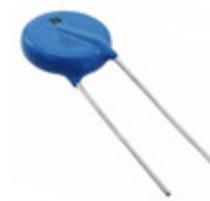
MOV-14D390KTR Bourns Inc. VARISTOR 39V 1KA DISC 14MM