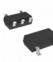
MIC5366-1.0YC5-TR Microchip Technology IC REG LDO 1V 0.15A SC70-5