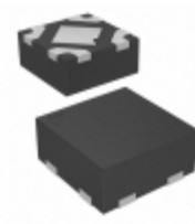
MIC5366-1.0YMT-TZ Microchip Technology IC REG LDO 1V 0.15A 4TMLF