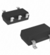
MIC5366-1.2YC5-TR Microchip Technology IC REG LDO 1.2V 0.15A SC70-5