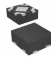
MIC5366-1.3YMT TR Microchip Technology IC REG LDO 1.3V 0.15A 4TMLF