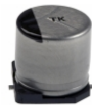
EEE-TK1K471AM Panasonic Electronic Components CAP ALUM 470UF 20% 80V SMD