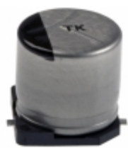
EEE-TK1K331AM Panasonic Electronic Components CAP ALUM 330UF 20% 80V SMD