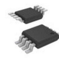
MIC5281-3.3YMM Microchip Technology IC REG LDO 3.3V 25MA 8MSOP