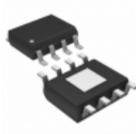
MIC5280YME Microchip Technology IC REG LDO ADJ 25MA 8SOIC