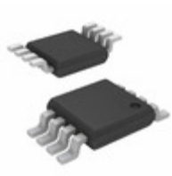
MIC5281-3.3YMM-TR Microchip Technology IC REG LDO 3.3V 25MA 8MSOP