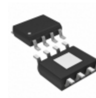
MIC5280YME-TR Microchip Technology IC REG LDO ADJ 25MA 8SOIC