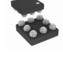
ADA4505-2ACBZ-RL Analog Devices Inc. IC OPAMP VFB 50KHZ RRO 8WLCSP