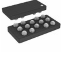
ADA4505-4ACBZ-RL Analog Devices Inc. IC OPAMP VFB 50KHZ RRO 14WLCSP