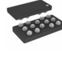
ADA4505-4ACBZ-R7 Analog Devices Inc. IC OPAMP VFB 50KHZ RRO 14WLCSP