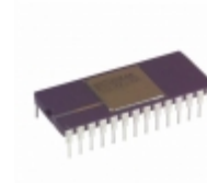
AD569AD Analog Devices Inc. IC DAC 16BIT MONO 28-CDIP