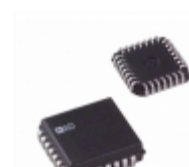
AD569JP Analog Devices Inc. IC DAC 16BIT MONO NON-LIN 28PLCC