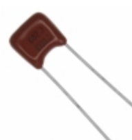
ECQ-B1682JF Panasonic Electronic Components CAP FILM 6800PF 5% 100VDC RADIAL