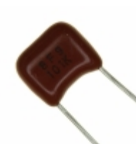
ECQ-B1H101KF Panasonic Electronic Components CAP FILM 100PF 10% 50VDC RADIAL