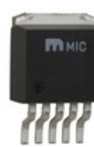
LM2575-3.3WU-TR Microchip Technology IC REG BUCK 3.3V 1A TO263-5