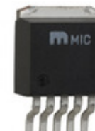
LM2575-5.0BU Microchip Technology IC REG BUCK 5V 1A TO263-5