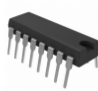
LM2575-5.0BN Microchip Technology IC REG BUCK 5V 1A 16DIP