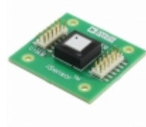
ADIS16265/PCBZ ADI (Analog Devices, Inc.) BOARD EVALUATION FOR ADIS16265