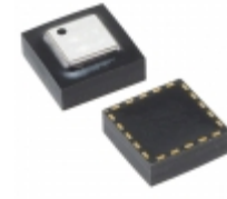
ADIS16266BCCZ Analog Devices Inc. IC GYROSCOPE YAW RATE SPI 20LGA