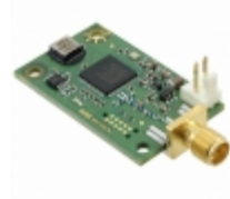
ADIS16229AMLZ Analog Devices Inc. SENSOR VIBRATION W/RF TXRX