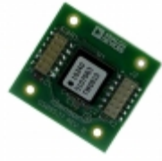
ADIS16240/PCBZ ADI (Analog Devices, Inc.) BOARD EVAL FOR ADIS16240