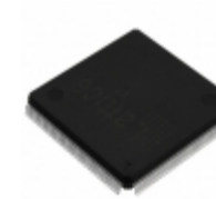
LFXP6C-5QN208C Lattice Semiconductor Corporation IC FPGA 142 I/O 208QFP