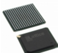
LFXP6C-5FN256C Lattice Semiconductor Corporation IC FPGA 188 I/O 256FBGA