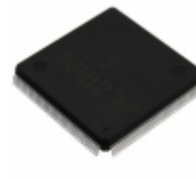
LFXP6C-5Q208C Lattice Semiconductor Corporation IC FPGA 142 I/O 208QFP