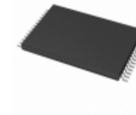
AT28BV64-20TI Microchip Technology IC EEPROM 64KBIT 200NS 28TSOP