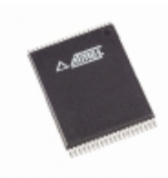
AT49F516-70VI Microchip Technology IC FLASH 512KBIT 70NS 40VSOP