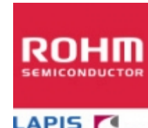
BR24T02FVM-W TR ROHM BR24T02FVM-W TR ROHM