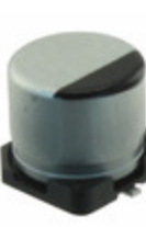
EEE-FT1V101AP Panasonic Electronic Components CAP ALUM 100UF 20% 35V SMD