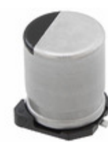
EEE-FT1H331GP Panasonic Electronic Components CAP ALUM 330UF 20% 50V SMD