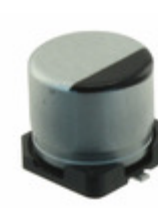
EEE-FT1H470AP Panasonic Electronic Components CAP ALUM 47UF 20% 50V SMD