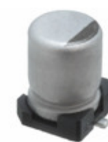
EEE-FT1V330AR Panasonic Electronic Components CAP ALUM 33UF 20% 35V SMD