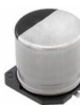
EEE-FT1E821GP Panasonic Electronic Components CAP ALUM 820UF 20% 25V SMD