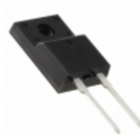
DHG10I1200PM IXYS DIODE GEN PURP 1.2KV 10A TO220FP