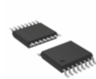
LMX1600TMX N/A IC FREQ SYNTHESZR 2.0GHZ 16TSSOP