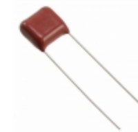
ECQ-E6473KFW Panasonic Electronic Components CAP FILM 0.047UF 10% 630VDC RAD