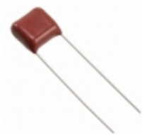
ECQ-E6473RKF Panasonic Electronic Components CAP FILM 0.047UF 5% 630VDC RAD