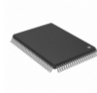
MB90587CAPF-GS-167 Cypress Semiconductor Corp IC MCU 16BIT 64KB MROM 100QFP