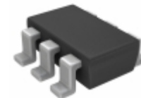
FDC6432SH Fairchild/ON Semiconductor MOSFET N/P-CH 30V/12V SSOT-6