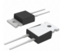
PF2203-1R2F1 Riedon RES 1.2 OHM 35W 1% TO220