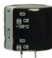
EET-ED2W121DA Panasonic Electronic Components CAP ALUM 120UF 20% 450V SNAP