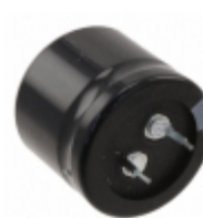
EET-ED2W181DA Panasonic Electronic Components CAP ALUM 180UF 20% 450V SNAP