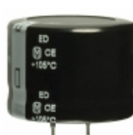
EET-ED2W151EA Panasonic Electronic Components CAP ALUM 150UF 20% 450V SNAP