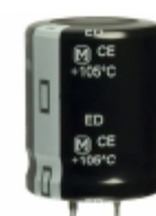
EET-ED2W101CA Panasonic Electronic Components CAP ALUM 100UF 20% 450V SNAP