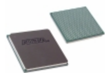
EP3C40F780I7 Intel® FPGAs IC FPGA 535 I/O 780FBGA