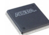
EP3C40Q240C8N Intel® FPGAs IC FPGA 128 I/O 240QFP