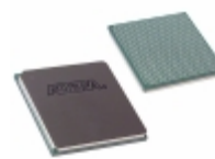
EP3C40F780I7N Altera IC FPGA 535 I/O 780FBGA