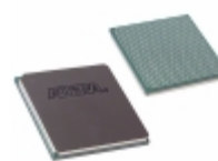
EP3C40F780I7N Intel® FPGAs IC FPGA 535 I/O 780FBGA