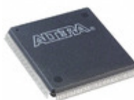
EP3C40Q240C8N Altera IC FPGA 128 I/O 240QFP