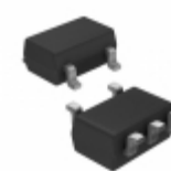
S-1165B47MC-N7GTFU SII Semiconductor Corporation IC REG LINEAR 4.7V 200MA SOT23-5