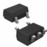
S-1165B49MC-N7ITFG SII Semiconductor Corporation IC REG LINEAR 4.9V 200MA SOT23-5