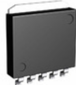
BA3257HFP-TR Rohm Semiconductor IC REG LDO 3.3V/ADJ 1A HRP5