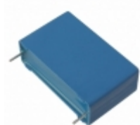
B32676G1685K000 EPCOS CAP FILM 6.8UF 10% 750VDC RADIAL