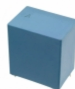
B32676G1106K EPCOS (TDK) CAP FILM 10UF 10% 750VDC RADIAL