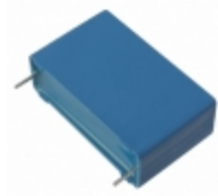
B32676G1905J EPCOS (TDK) CAP FILM 9UF 5% 750VDC RADIAL