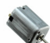
SE10G0UTMAF NMB Technologies Corp. BRUSH MOTOR DC 10MM X 15MM