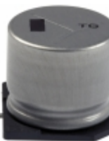
EEV-TG1C332M Panasonic Electronic Components CAP ALUM 3300UF 20% 16V SMD