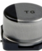
EEV-TG1E101UP Panasonic Electronic Components CAP ALUM 100UF 20% 25V SMD