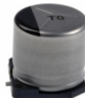
EEV-TG1C331UP Panasonic Electronic Components CAP ALUM 330UF 20% 16V SMD