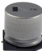
EEV-TG1E102M Panasonic Electronic Components CAP ALUM 1000UF 20% 25V SMD