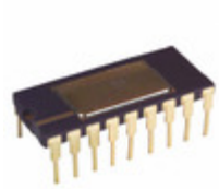
AD570SD/883B Analog Devices Inc. IC ADC 8BIT MONO W/CLOCK 18CDIP