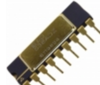
AD571SD Analog Devices Inc. IC ADC 10BIT MONO W/CLK 18- CDIP