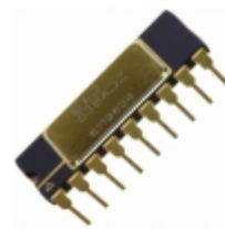
AD570SD Analog Devices Inc. IC ADC 8BIT MONO W/CLOCK 18-CDIP