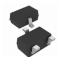
MCP112T-315E/LB Microchip Technology IC VOLT DET 3.08V LOW SC70-3