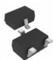
MCP112T-290E/LB Microchip Technology IC SUPERVISOR 2.90V LOW SC70-3