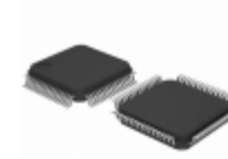
MC68HC908LK24CFU NXP USA Inc. IC MCU 8BIT 24KB FLASH 64QFP