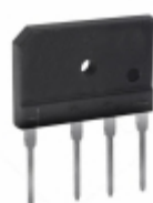
GBJ606 Diodes Incorporated RECT BRIDGE GPP 600V 6A GBJ