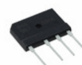
GBJ610TB Sensitron Semiconductor / SMC Diode Solutions BRIDGE RECT 1PHASE 1KV 6A GBJ