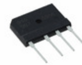
GBJ608TB Sensitron Semiconductor / SMC Diode Solutions BRIDGE RECT 1PHASE 800V 6A GBJ