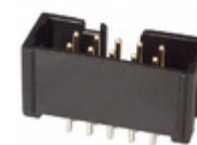
N2510-6003-RB 3M CONN HEADER 10POS STR GOLD T/H