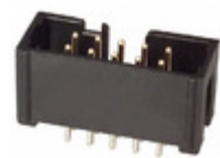
N2510-6003-UB 3M CONN HEADER 10POS STR GOLD T/H