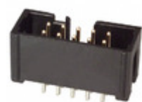
N2510-6003-UG 3M CONN HEADER 10POS STR GOLD T/H