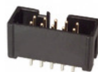
N2510-60K2-UB 3M CONN HEADER 10POS STR GOLD T/H