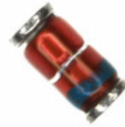
DL4751A-TP Micro Commercial Co DIODE ZENER 30V 1W MELF