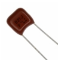
ECQ-P1H821JZ Panasonic Electronic Components CAP FILM 820PF 5% 50VDC RADIAL