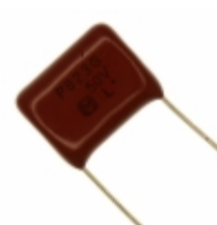
ECQ-P1H823GZ Panasonic Electronic Components CAP FILM 0.082UF 2% 50VDC RADIAL