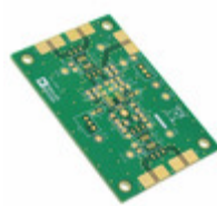
AD8138AR-EBZ ADI (Analog Devices, Inc.) BOARD EVAL FOR AD8138AR