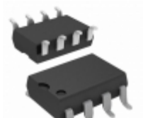
HCPL-7721-520 Broadcom Limited OPTOISO 5KV PUSH PULL 8DIP GW