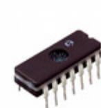
TC9401EJD Microchip Technology IC V-FREQ/FREQ-V CONV 14CDIP