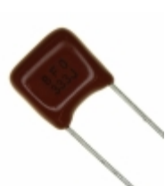
ECQ-B1H333JF Panasonic Electronic Components CAP FILM 0.033UF 5% 50VDC RADIAL