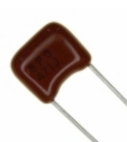
ECQ-B1H471JF Panasonic Electronic Components CAP FILM 470PF 5% 50VDC RADIAL